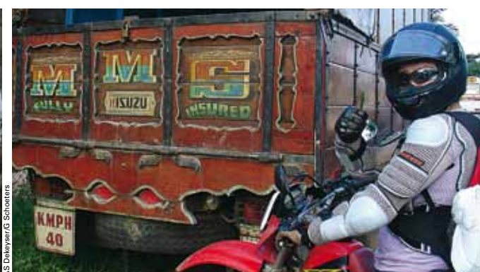
EN HAUT À GAUCHE : ELÉPHANTS AU PINNAWELA ELEPHANT ORPHANAGE. EN HAUT À DROITE : ECHOPPE-TERRASSE AU LIPTON'S SEAT. AU MILIEU À GAUCHE : LE TRÈS SAINT TEMPLE DE LA DENT, À KANDY. EN BAS À DROITE : MACAQUE À DAMBULLA. ET UN CAMION FULL ASSURÉ (EN BAS À DROITE).

Quand nous nous arrêtons à Negombo, je constate que mon compteur kilométrique indique 124. Notre mission est plus qu'accomplie! Nous rentrons nos bécanes avec un pincement de cœur. Elles se sont très bien comportées, et même si elles n'auraient jamais passé le contrôle technique sous nos latitudes, ce sont de loin les meilleures motos que nous avons vues sur l'île. Qui plus est: elles nous ont emmenées dans des endroits magnifiques où nous n'aurions jamais pu nous rendre sans disposer d'un moyen de transport à nous. De plus, grâce à l'oubli de Suranga et le retard pris au début de notre aventure, nous avons maintenant une bonne raison de revenir. Nous devons encore visiter Jaffna, dans le Nord. Polonaruwa, le principal site historique, était inaccessible à cause des inondations. Et il y a encore d'excellentes pistes off-road dans la région de Knuckles Range et de Corbet's gap, qui étaient impraticables à cause des glissements de terrain. Car, en fin de compte, nous sommes quand même un peu tombées amoureuses de cette Larme de Bouddha. C'est une île qui a tout: