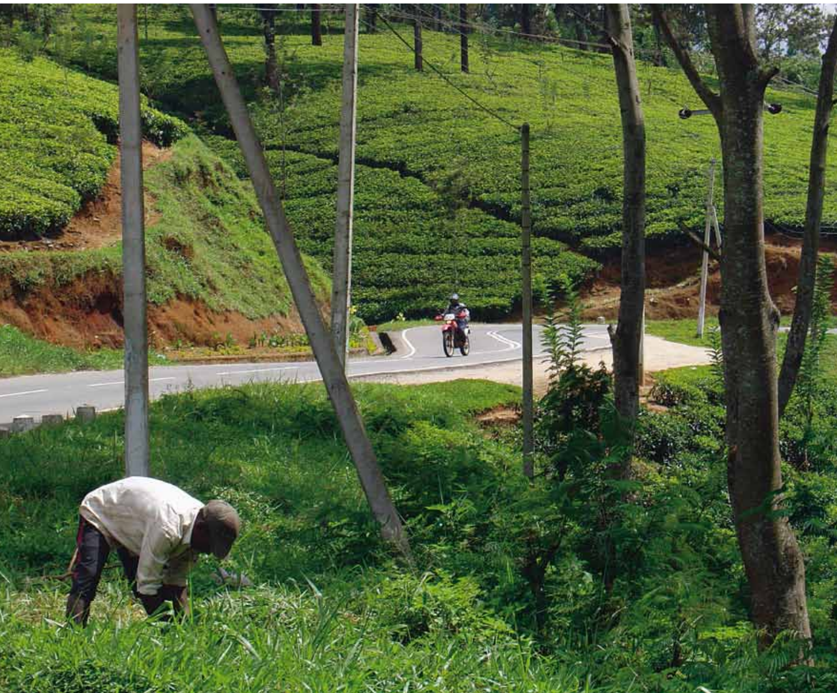
DEPUIS KANDY, LA ROUTE SERPENTE DANS LES COLLINES, ET À CHAQUE VIRAGE LE PAYSAGE EST DE PLUS EN PLUS VERT, JUSQU'À CE QUE NOUS NE SOYONS PLUS ENTOURÉES QUE DE PLANTATIONS DE THÉ.

heures d'un garage à l'autre, d'un vendeur de pièces détachées à l'autre. En fin d'après-midi, les 2 motos sont prêtes à prendre la route. Il ne reste plus qu'à signer les papiers. «Heu, des papiers... En fait, les motos ne sont pas vraiment assurées. En cas d'accident, même si vous êtes en droit, vous devez quand même payer. Et elles ne sont pas non plus immatriculées. Qu'à cela ne tienne, je fabrique des faux. Only small problem.» Pas de deal donc.