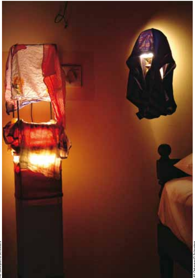
TAMOULS AU TRAVAIL DANS LES PLANTATIONS. A DROITE : LUMIÈRE TAMISÉE POUR CE SÉCHOIR IMPROVISÉ.

rant. Ce n'est peut-être pas une bonne idée de poursuivre vers l'Est. Nous n'irons donc pas à Polonnaruwa, la ville royale numéro 2. Nous mettons le cap sur Dambulla. A peine 5 kilomètres plus loin, un soldat armé d'une mitraillette nous fait signe de nous arrêter. Nous nous mettons en quête des papiers du véhicule, quand il nous fait comprendre qu'il a d'autres intentions: « Money, je vends des billets de loterie pour l'armée! ». C'est une technique de vente comme une autre, non?