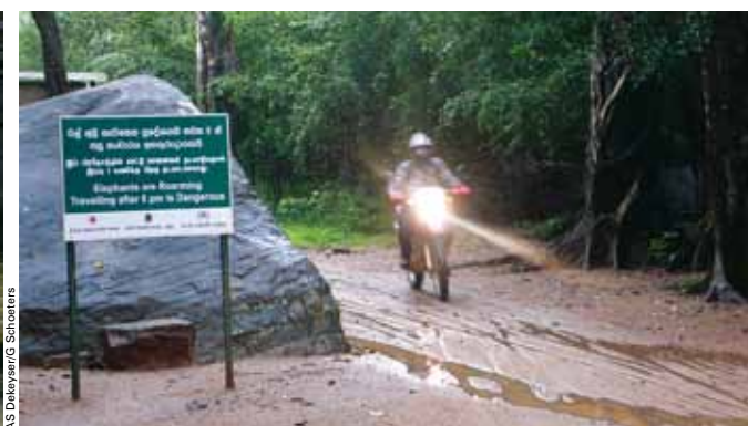
A GAUCHE: LA MOITIÉ DU PAYS EST SOUS EAU, MAIS QUE VOULEZ-VOUS FAIRE DE PLUS QUE DE RESTER STOÏQUE ET VOUS EN REMETTRE A BOUDDHA ? 'DES INONDATIONS ? AU SRI LANKA ? NO MADAM, IMPOSSIBLE. EVERYTHING OKAY.' EN HAUT À DROITE : NOUVEAU PNEU & VIEUX PNEU IN EXCELLENTE CONDITION. EN BAS À DROITE: "ELEPHANTS ARE ROAMING. TRAVELLING AFTER 6PM IS DANGEROUS". VOUS ÊTES PRÉVENUS !

que la route ressemble à un lavabo. Ma roue arrière tanguait de tout côté, je commence vraiment à me faire du souci. On n'aperçoit plus aucun poteau indicateur au bord de la route. Soudain, des soldats font irruption devant nous. Pas trop à mon aise, je poursuis mon chemin. Ils me laissent passer. Seulement, il y en a encore et encore. Nous passons en revue une haie d'honneur de plusieurs dizaines de mètres de soldats, mitrailleuse au poing, qui sont ici en manœuvre. Après les avoir dépassés, nous nous regardons en riant nerveusement. Formidable! La route prend de la hauteur, virage après virage. Le paysage est de plus en plus paisible autour de nous, l'atmosphère est quasi mystique. Et puis soudain, une barrière surgit devant nous. Un jeune homme s'approche et nous fait comprendre que nous ne pouvons pas entrer dans le parc. « This way closed. » Il n'en démord pas et nous faisons demi-tour, peut-être avons-nous raté une bifurcation? Mais les virages nous ramènent en bas, chez