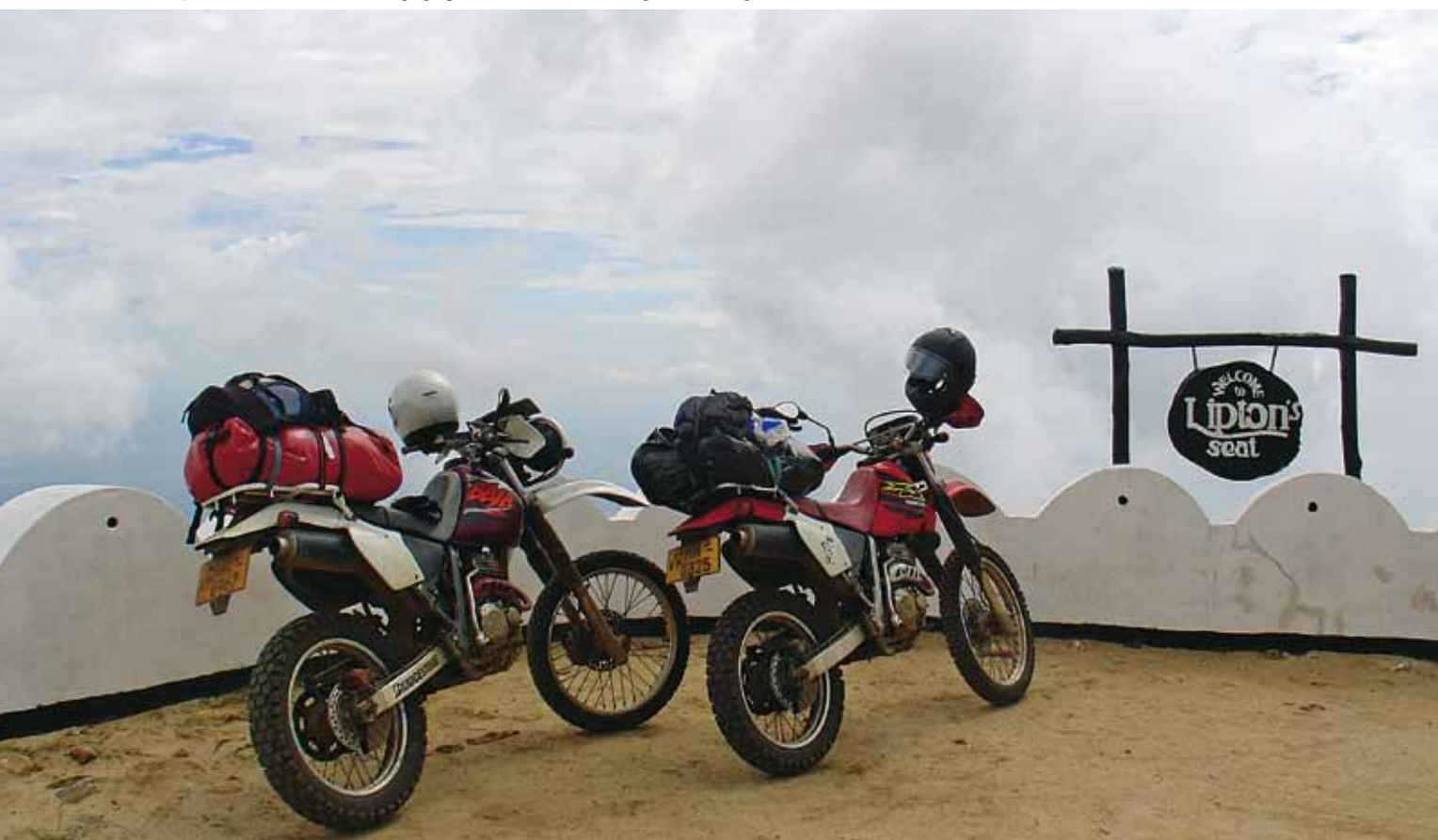
AS Dekeyser/C. Scholten

LA ROUTE NOUS EMMÈNE DROIT DANS LES NUAGES. NOUS ROULONS LITTÉRALEMENT AU CIEL, AVEC À NOS PIEDS LES INCONTOURNABLES PLANTATIONS DE THÉ. UN HOMME VIENT À NOTRE RENCONTRE : "TEA FOR TWO ?"